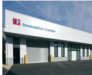
イノベーションセンター

駐車台数には限りがございます。ご来場の際は、出来るだけお車に乗り合わせの上お越しいただくか、公共交通機関をご利用くださいますよう、ご協力お願い申し上げます。