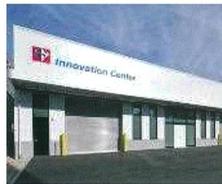
イノベーションセンター

駐車台数には限りがございます。ご来場の際は、出来るだけお車に乗り合わせの上お越しいただくか、公共交通機関をご利用くださいますよう、ご協力お願い申し上げます。